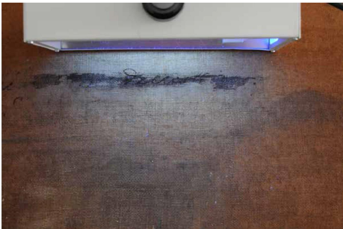
Inskrypcja oświetlona promieniami UV, fot. Lesław Cześniak

to ślad zmytego napisu i może mylić w ocenie charakteru pisma. Zdaniem autora niniejszego komunikatu napisy wykonała ta sama ręka i nie można wykluczyć, że to była ręka Leona Wyczółkowskiego.