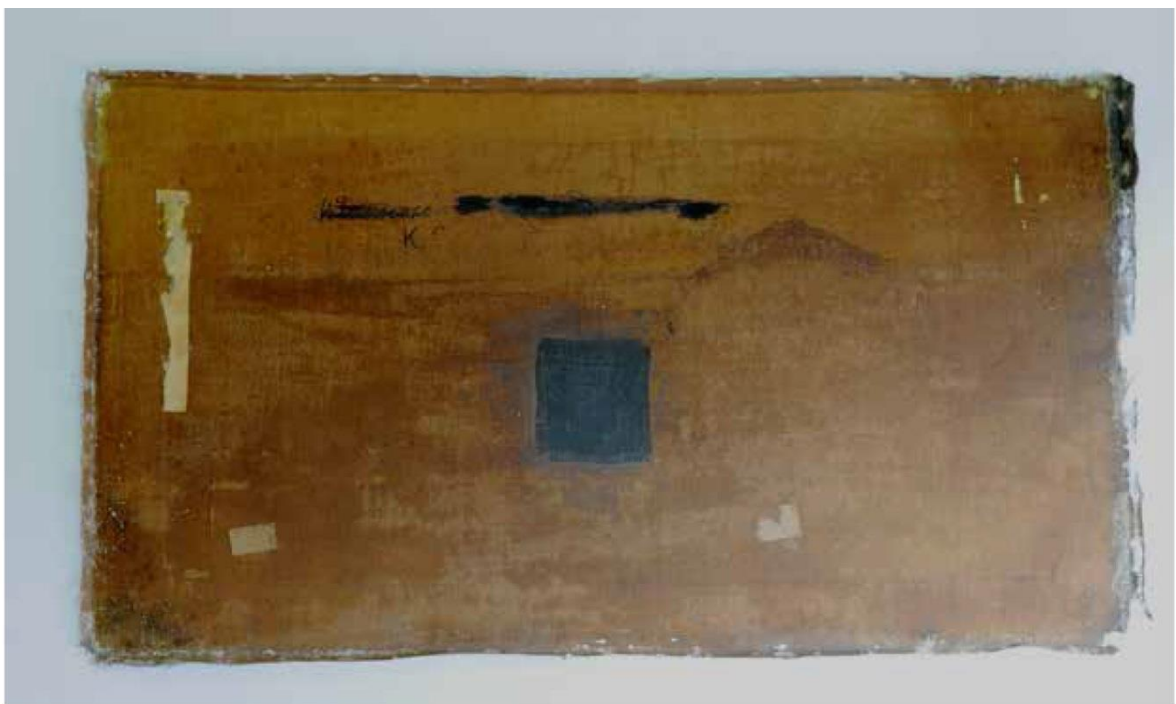
Odwrocie. Stan w trakcie konserwacji. Dawne naprawy spękań i rozdarć płótna

Odwrocie oryginalnego płótna było zaplamione na skutek przeniknięcia werniksu do płótna poprzez spękania warstw wierzchnich. Krosno z listew fazowanych łączonych widlicowo, pojedynczo. Dobijane w przeszłości kliny przeszły na przestrzał i rozchyliły