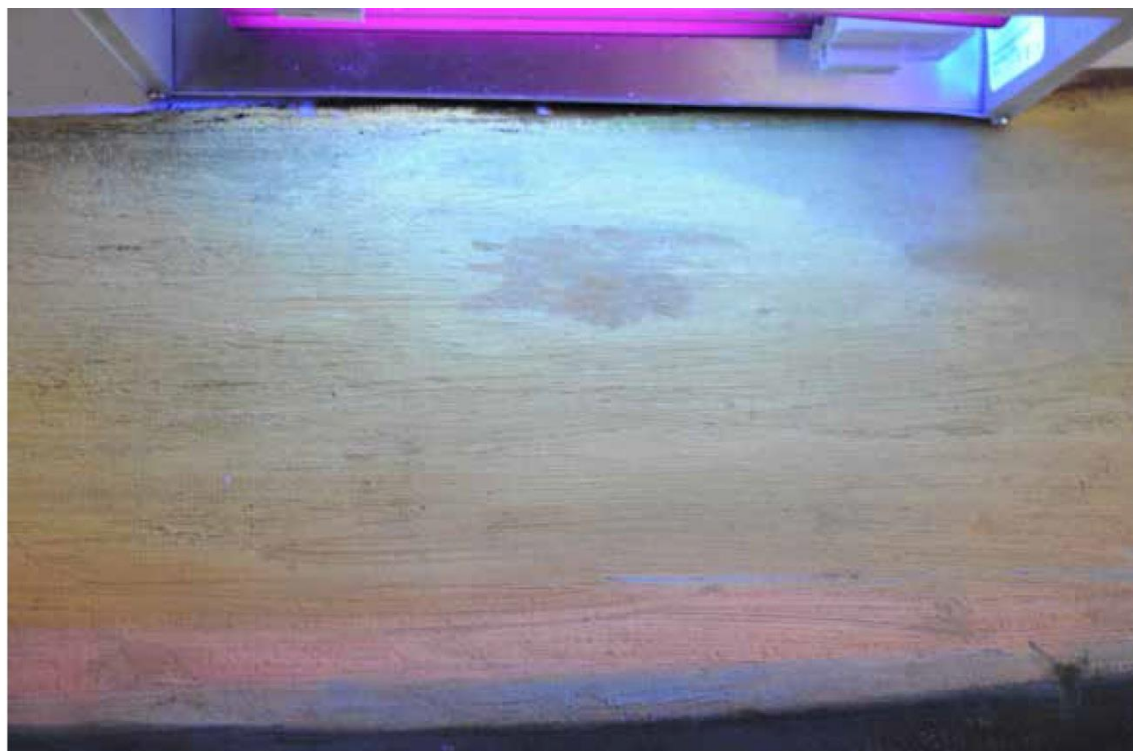
Fragment górnej części obrazu, luminescencja wzbudzona UV. Punktowy (1 x 2 mm) ubytek warstwy malarskiej i wgniecenie zamaskowane przemalowaniem oryginalnej warstwy malarskiej

Odnotowano też punktowe ubytki zaprawy rozsiane w dolnej części obrazu przy krawędzi i w narożnikach. Występują one w miejscach, gdzie warstwa malarska ma charakter nieciągły. W miejscach narażonych na większe naprężenia warstwa zaprawy nie przesycona olejem okazała się bardziej krucha i jej fragmenty wypadały z przestrzeni pomiędzy nitkami rzadkiej tkaniny. W trakcie wcześniejszej konserwacji z różnym skutkiem próbowano je wypełnić brązową farbą. Rozdarcia płótna naprawiano od strony odwrocia paskami papieru przy użyciu wodorozcieńczalnego kleju oraz łatkami z płótna przyklejonymi masą woskową. Ubytki płótna w narożnikach nie były naprawiane łatkami. Dla zamaskowania napraw obraz nabito na krosno po podłożeniu tzw. tkaniny papierowej a właściwie plecionki o splocie płóciennym wykonanej fabrycznie ze skręconych wąskich papierowych pasków 5 . Był to tzw. luźny dublaż bez użycia żadnego spoiwa. W narożnikach położono wówczas białe kity klejowo-kredowe, które przywarły do wtórnego podłoża i pozostały na nim po zdjęciu obrazu z krosna w trakcie bieżącej konserwacji. Ubytki warstwy malarskiej wypełniano kitami klejowymi z białym wypełniaczem oraz kitami woskowymi barwionymi w masie. Zróznicowanie materiałów użytych od reparacji wskazuje, że obraz mógł być konserwowany dwukrotnie.