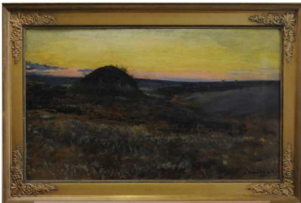
Leon Wyczółkowski, Kurhan na Ukrainie, olej, płótno, 1894, MOB W. 518. Stan przed konserwacją

swobodna. Wydłużony format kadru, pomimo niewielkich rozmiarów obrazu, daje wrażenie szerokiej perspektywy. Interesującym efektem warsztatowym jest swoista inwersja w układzie tekstury warstwy malarskiej. Pierwszy plan malowany był z wykorzystaniem koloru zaprawy, stosunkowo cienko, oszczędnie, oddzielnymi uderzeniami i pociągnięciami wąskich pędzli. Natomiast górną, „powietrzną” część przedstawienia artysta malował grubo, mięsście, opracował miękkimi, wydłużonymi pociągnięciami. Dukt pędzla utrwalony w gęstej farbie tworzy istotny dla estetyki obrazu dekoracyjny relief.