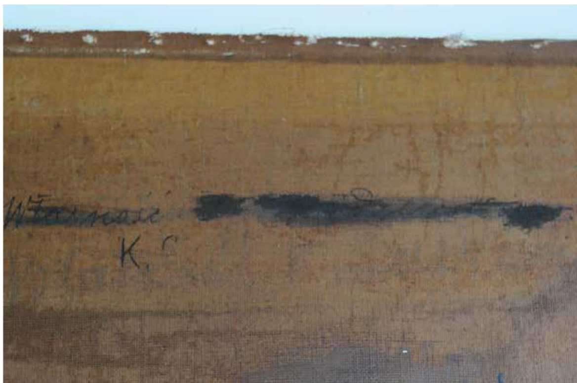
Inskrypcja na odwrociu w świetle widzialnym, fot. Lesław Cześniak

Po zdjęciu oryginalnego płótna z krosna na jego odwrociu stwierdzono niewzmiankowaną dotąd inskrypcję, wykonaną czarnym tuszem lub farbą, częściowo zamalowaną i nieczytelną. Jest to napis odnoszący się do właściciela obrazu. Usunięto nieznacznie zamalowanie na tyle, ile było to możliwe bez uszkodzenia samego napisu. Podjęto próby odczytania jej w świetle widzialnym i promieniach UV. Ponieważ interpretacja budziła wątpliwości wykonano fotografię w podczerwieni.