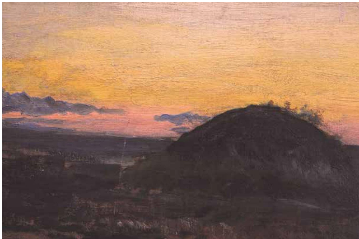
Fragment obrazu. Widoczne zróżnicowanie malarskiej faktury

warstwy malarskiej. Uzupełnienia uszkodzeń warstwy malarskiej, wykonane farbami olejnymi, zachodziły na oryginalną warstwę malarską szczególnie w partii nieba. Próbowano w ten sposób zamaskować niewyprostowane dostatecznie wklęsnięcia w miejscach uderzenia i nieuniknioną w takich przypadkach siatkę spękań.