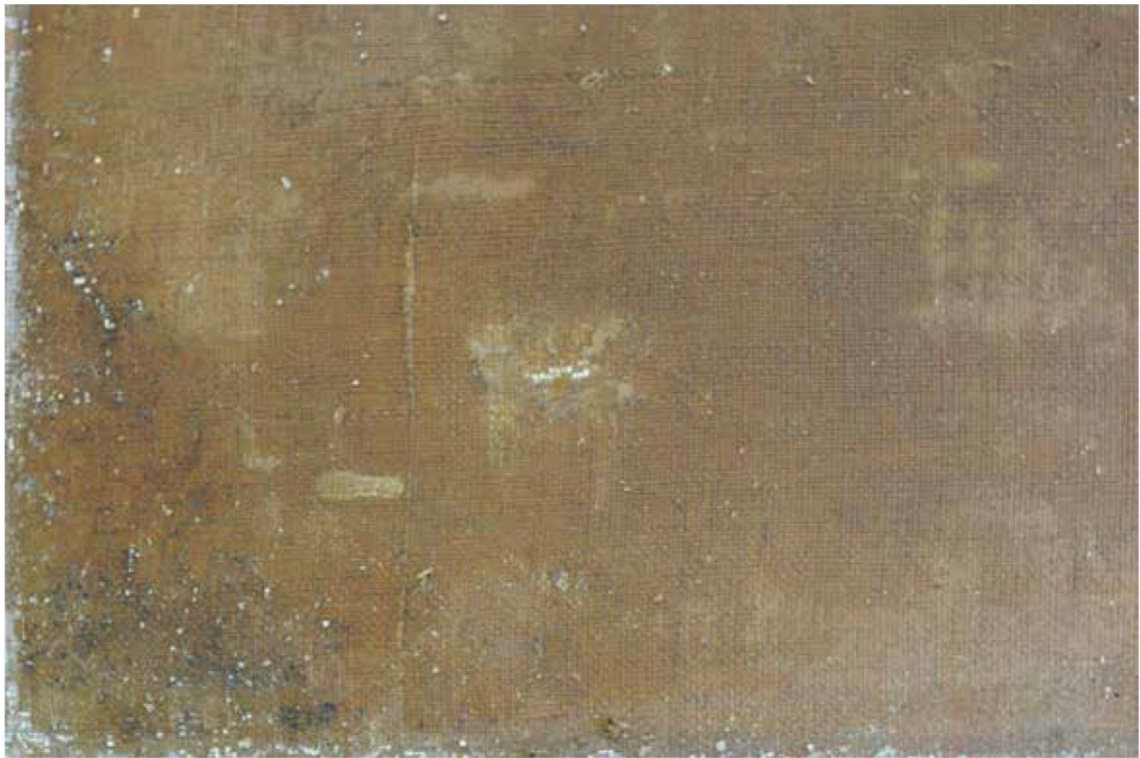
Fragment odwrocia: w narożniku i przy krawędziach ubytki zaprawy. Spękanie, nie przesyczone olejem, kruche fragmenty wypadały z „oczek” rzadkiego płótna