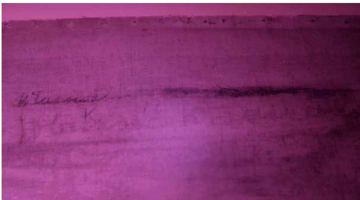
Odwrocie, fotografia w podczerwieni. Poniżej litery K nieujawniona wcześniej inskrypcja „Własność Kaweckiej”, fot. Wojciech Woźniak